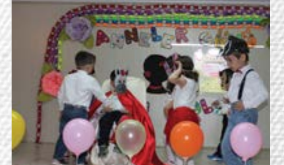
Anneler Günü Programı