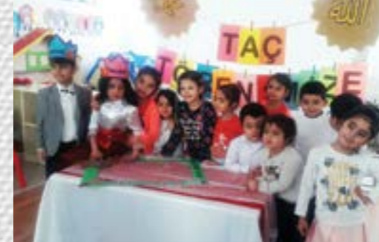
Kur'an Kursu Taç Giyme Töreni