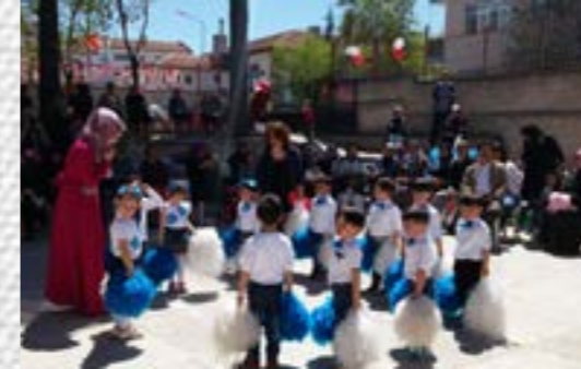
23 Nisan Programı