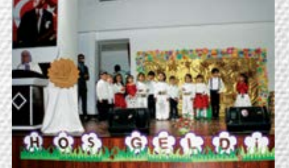
Kutlu Doğum Haftası Programı